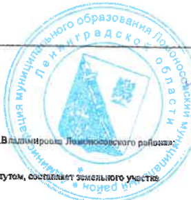
Схема границ публичного сервитута