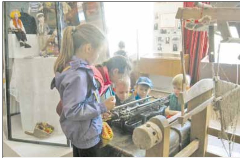
В историко-краеведческом музее Ломоносовского района многие экспонаты можно не только осмотреть, но и попробовать в работе