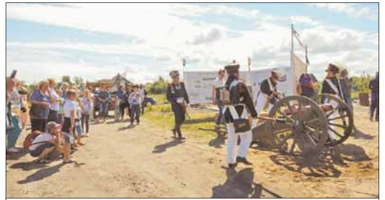
В Ломоносовском районе активно внедряют новые формы проведения экскурсий. На снимке – театрализованная историческая экскурсия с участием клуба реконструкторов-артиллеристов военно-исторического общества «Форт Красная Горка»

Мы понимаем, что самобытность, аутентичность – это то, что сегодня привлекает туристов и может являться стимулом для развития территории в целом. И таким стимулом является народное творчество, ремесло. Именно поэтому, каждый год в рамках праздника «Копорская потеха» проводится выставка-ярмарка «Копорский сувенир». В продолжение этой темы специалистами информационно-туристского центра (ИТЦ) Ломоносовского района организованы ежемесячные авторские выставки ремесленников Ломоносовского района, на презентацию которых приглашаются все желающие. Отзывы посетителей