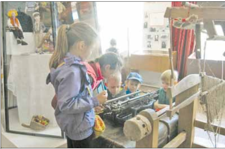
В историко-краеведческом музее Ломоносовского района многие экспонаты можно не только осмотреть, но и попробовать в работе