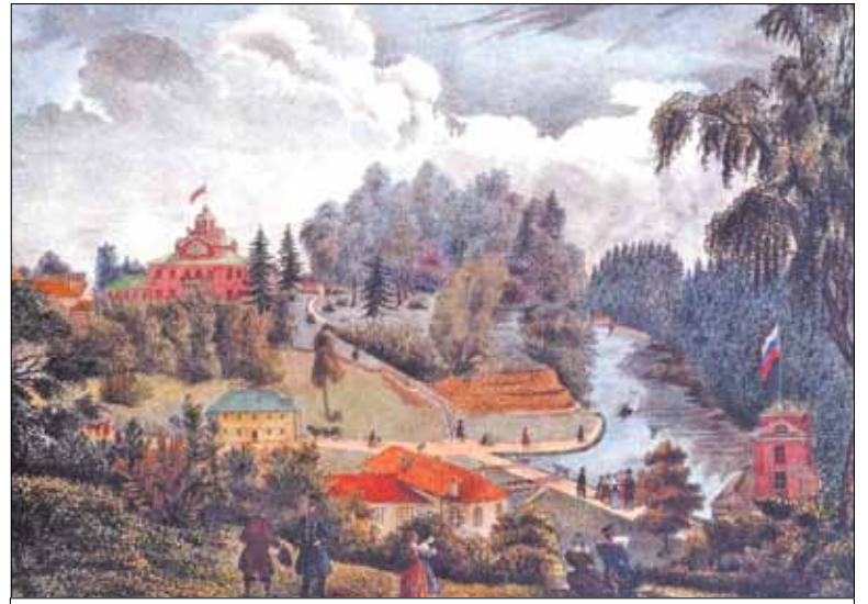
Лопухинка на старинной гравюре

Прибывающие сюда туристы, как правило, совершают небольшую прогулку по берегу озера, что рядом с плотиной, фотографируются на фоне небесно-голубых вод и уезжают, не подозревая при этом, что пропускают один очень важный объект – это каньон реки Лопухинка с его выходами геологических пород ордовикского периода возрастом в 450 миллионов лет. Состоят они из известняков и хранят в себе окаменелые останки доисторических животных.