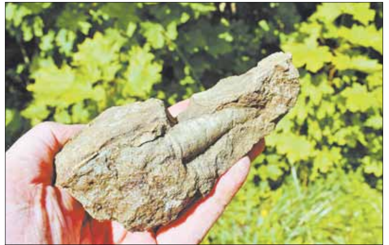
Застывший доисторический трилобит, найденный в Лопухинке