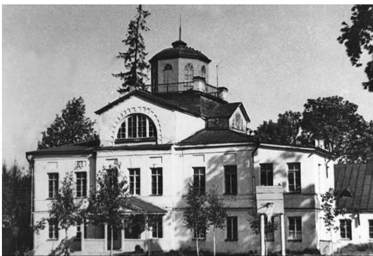
Старое фото водолечебницы