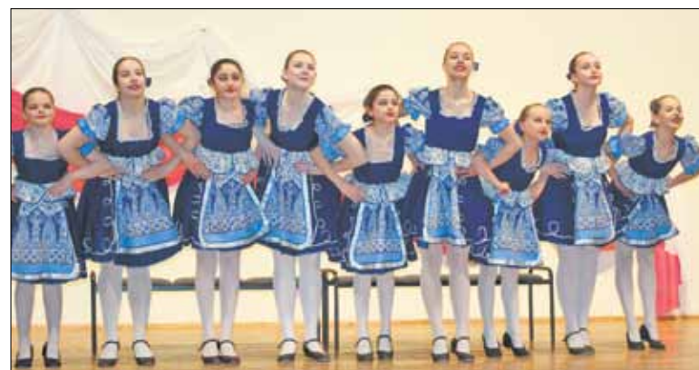
Хореографический коллектив «Фантазия» Лопухинского ДК