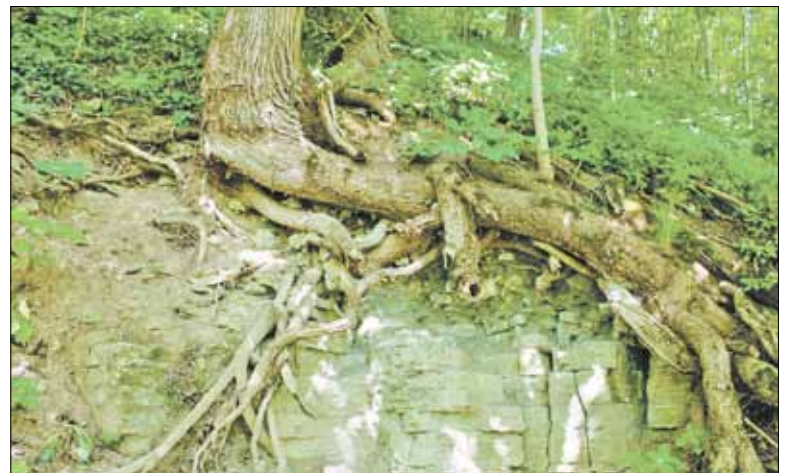
Обрыв Лопухинского каньона

Большому количеству всевозможных окаменелостей в местном известняке способствовал газ радон. Вероятно, ещё задолго до Лопухиных и Герингов о наличии у радона полезных свойств догадались другие – трилобиты и им подобные. Однако в силу объективных причин, они не могли правильно оценить степень угрозы, исходящей от радиоактивных элементов, а потому процент выздоравливающих трилобитов и трубочников был чрезвычайно мал: многие гибли от передозировки, именно их следы мы наблюдаем сегодня.