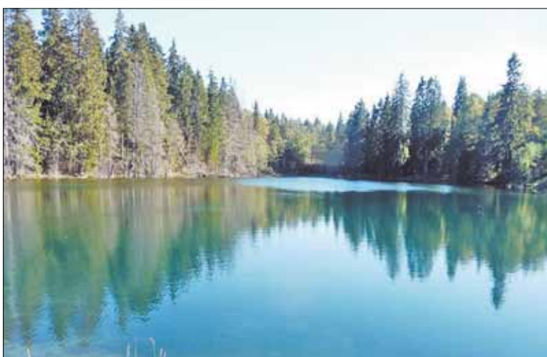
Лопухинское радоновое озеро

Лопухинка сегодня – это поселение с развитой инфраструктурой, численность населения которого свыше 3200 человек. На территории муниципального образования находится Лопухинская общеобразовательная средняя школа на 800 мест, Глобичская общеобразовательная средняя школа, детский сад №24 «Родничок», Лопухинская детская школа искусств, амбулатория, дом культуры. Предприятия в Лопухинском сельском поселении в основном сельскохозяйственного (например, КФХ «Савольщина») и рекреационного («Горки Гольф клуб», конный клуб «Усадьба Бахарева») направлений.