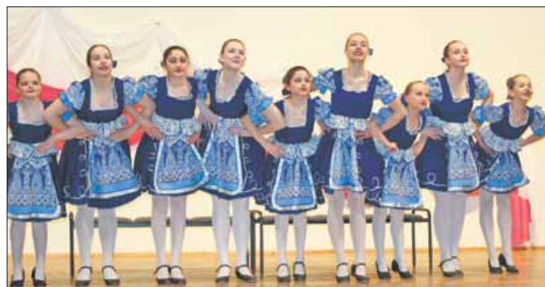
Хореографический коллектив «Фантазия» Лопухинского ДК

Большому количеству всевозможных окаменелостей в местном известняке способствовал газ радон. Вероятно, ещё задолго до Лопухиных и Герингов о наличии у радона полезных свойств догадались другие – трилобиты и им подобные. Однако в силу объективных причин, они не могли правильно оценить степень угрозы, исходящей от радиоактивных элементов, а потому процент выздоравливающих трилобитов и трубочников был чрезвычайно мал: многие гибли от передозировки, именно их следы мы наблюдаем сегодня.